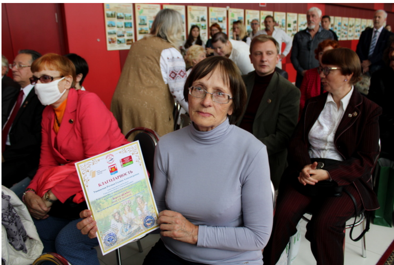
Госці літаратурнага форуму з Расіі прэзентавалі нумар газеты "Кубанский писатель", большая палова якога была прысвечана