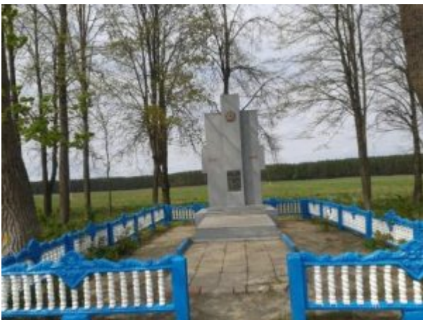
Братская могила (1943 год), аг. Поколюбичи