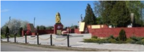
Братская могила (1943 год), д. Глыбоцкое