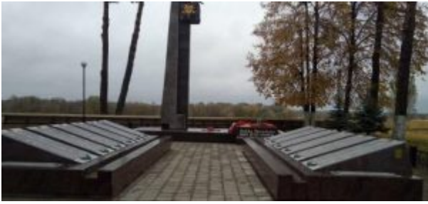
Братская могила (1943 год), д. Прокоповка