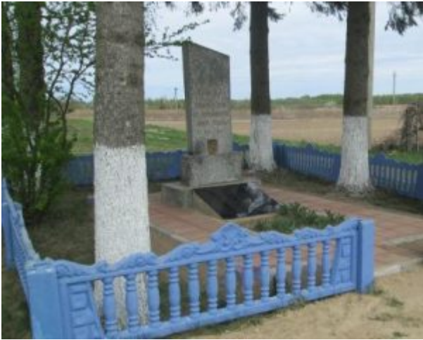
Братская могила (1943 год), д. Рудня Маримонова