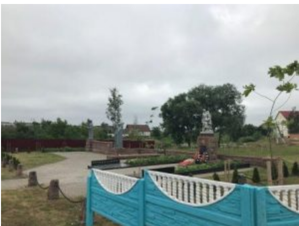
Братская могила (1943 год), п. Будилка