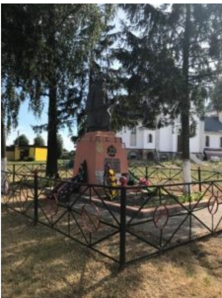
Братская могила (1943 год), аг. Красное