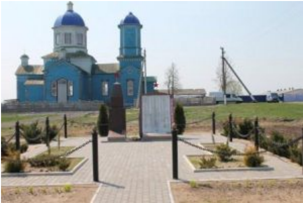
Братская могила (1943 год), д. Марковичи