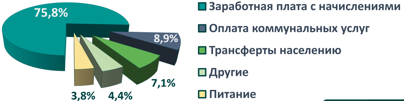
Структура расходов социальной сферы

В структуре расходов 51 030,1 тыс.рублей или 95,6% составляют первоочередные расходы (выплата заработной платы с взносами (отчислениями) на социальное страхование, трансферты населению, оплата продуктов питания, коммунальных услуг), которые в приоритетном порядке предусмотрены местным бюджетам.