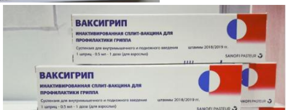
«Ваксигрип Тетра», «Sanofi Pasteur S.A.» Франция